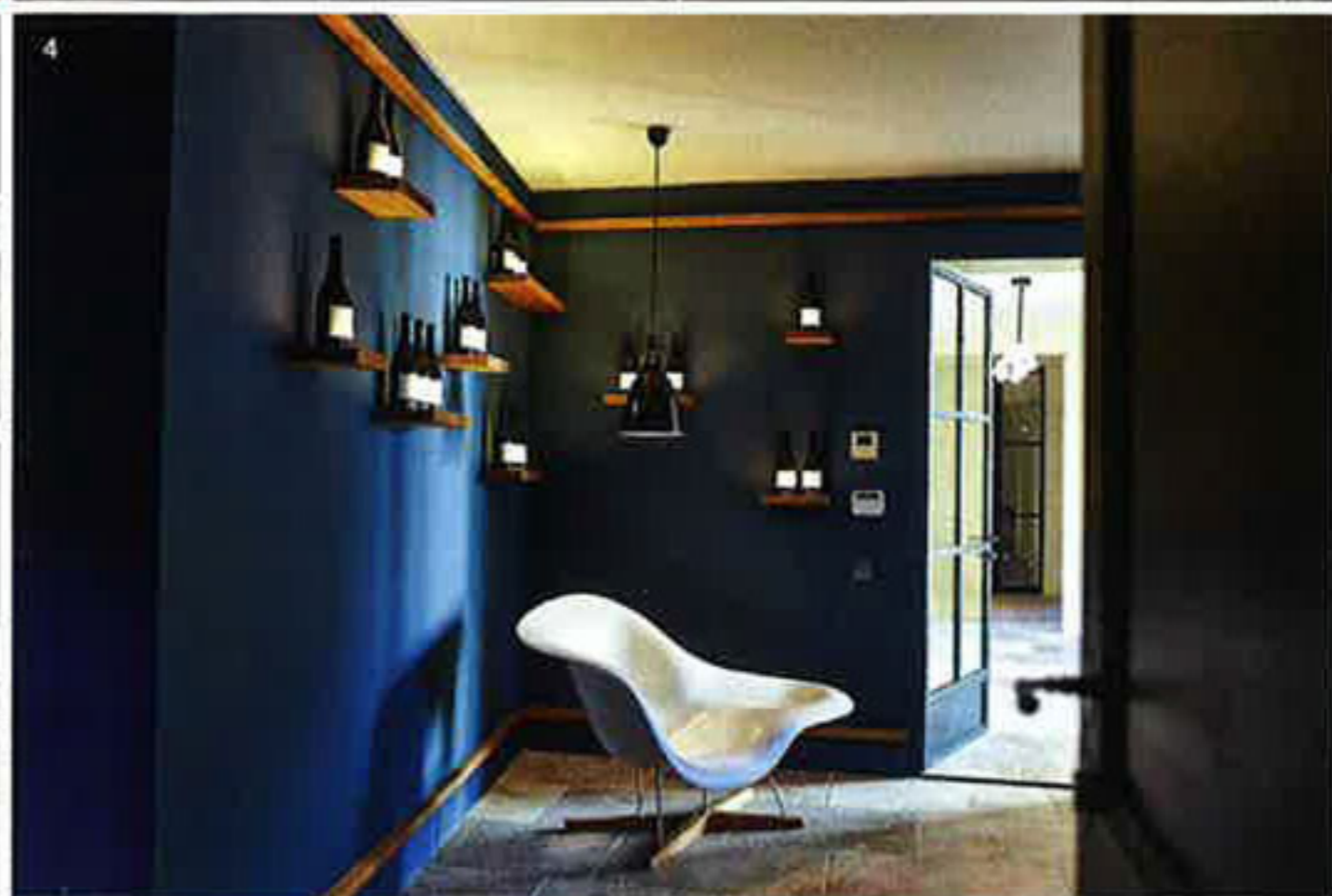
1 et 2. Rouge intense, blanc floral et rosé expressif sont vinifiés dans de nouveaux chais ultra-techniques. Vendus à la cave où se déroulent initiations gourmandes à l'œnologie. 3. Exposition «Being Beauteous» au centre d'art du domaine. 4. Mur bleu Klein, étagère de flacons gouleyants et fauteuil «La Chaise» de Ray & Charles Eames, Vitra, la réception donne le ton! Ci-dessous , des barriques neuves et des créations du chef: «L'œuf du Puy-Sainte-Réparate» envahi de fleurs, touches d'herbes, sabayon jasmin et le «Miam», chocolat Valrhona, noisette du Piémont, glace truffe Tuber Borchii .